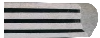
ヘリ継手溶接の断面マクロ

パルス電流によるアークの広がりがよく、溶接ビードと母材とのなじみがよくなるため、薄板のヘリ、カド、重ねなどの継手の溶接が容易で、均一な結果が得られます。