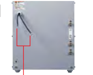
入力側端子(M6用圧着端子付)