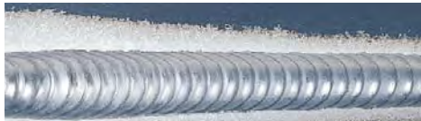
交流TIG溶接(アルミニウム)のクリーニング幅調整機能

アルミ溶接のビード外観や裏波などの溶接品質に大きな影響を与えるクリーニング幅をツマミ1つで連続調整でき、材質や開先形状に応じて最適なクリーニング幅に設定できます。